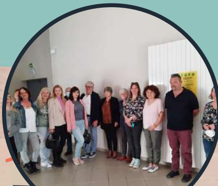
Accueil des familles Ukrainiennes