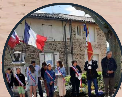
Commémoration du 8 Mai Municipalité de St Georges-les-Bains