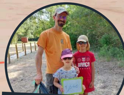
Clean My Saint-Georges organisé par le CME