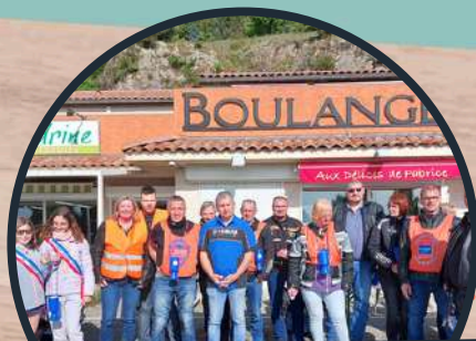
Vente de roses au profit de l'association "Une rose, un espoir"