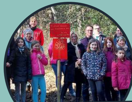
Une naissance, une essence