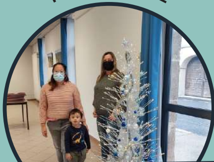
Collecte des boîtes de Noël pour le CCAS